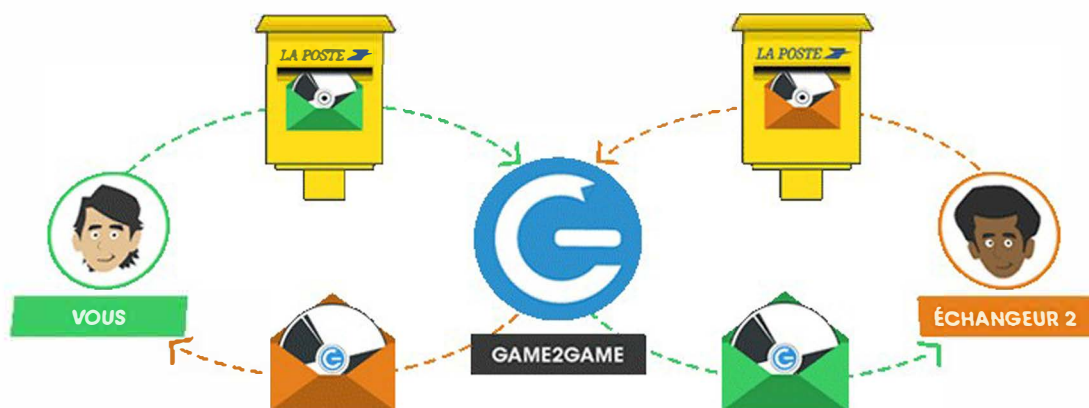
Cycle d'un échange postal chez Game2Game